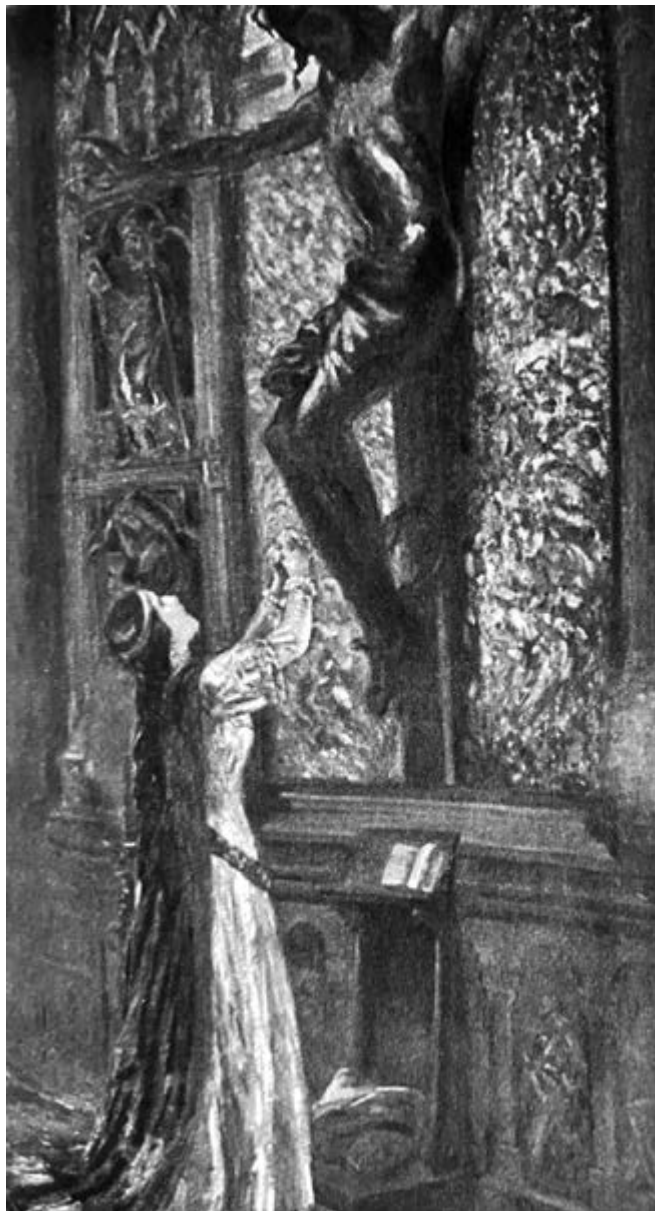
Modlitwy królowej o przyszłości kraju przed czarnym Krucyfiksem.