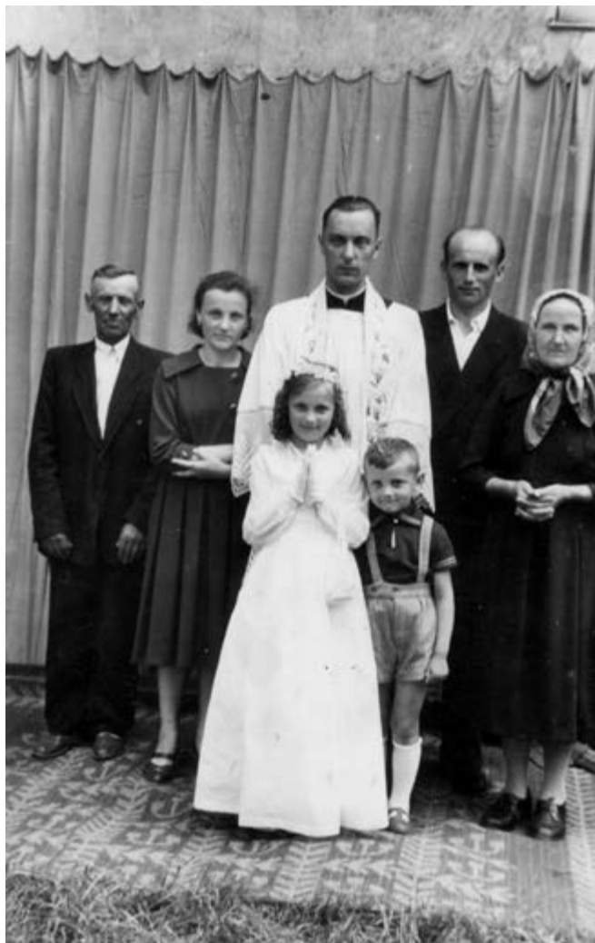
Od lewej strony mój Tatuś i moja Siostra, po prawej mój Szwagier i moja Mamusia, przede mną moja Siostrzenica i mój Siostrzeniec

Do I Komunii św. już miałem tenisówki, które jednak założyłem dopiero przed kościołem. Po przy-